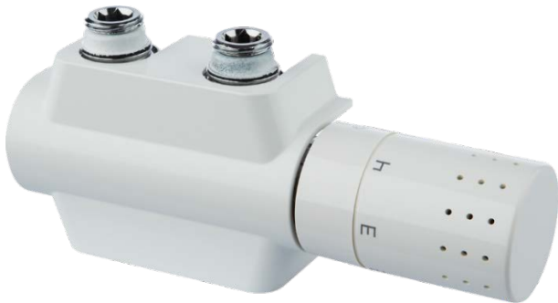
Fig. 1: Logafix universal fitting set