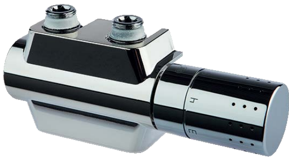
Fig. 2: Logafix universal fitting set, chrome version